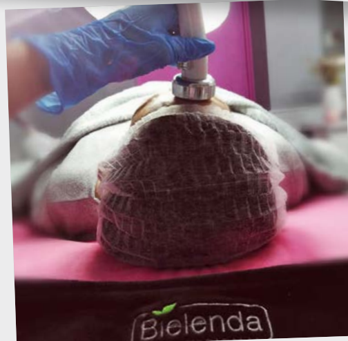
Salon Urody Diament Angelika Antczak