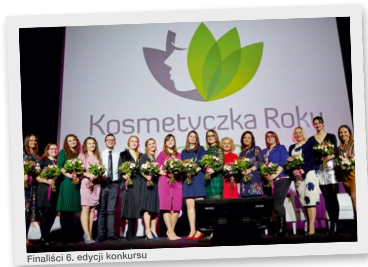
Finaliści 6. edycji konkursu

NAGRODA GŁÓWNA O WARTOŚCI 60 000 ZŁ W TYM – SAMOCHÓD ORAZ NAGRODY RZECZOWE