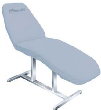
Pokrowiec na fotel