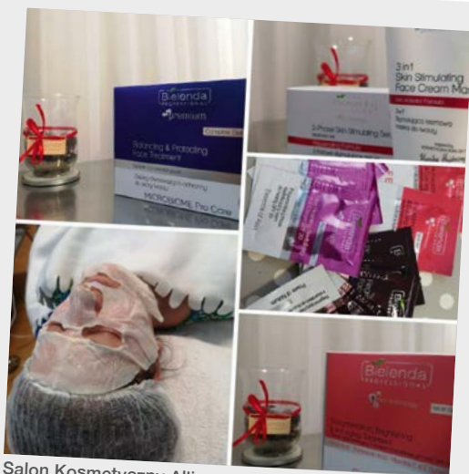
Salon Kosmetyczny Alicje